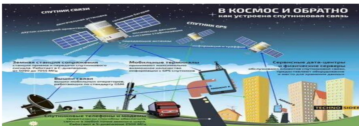
Рисунок 1 - Как работает спутниковая связь

Как работает спутниковая связь показано на рисунке 1 [30].